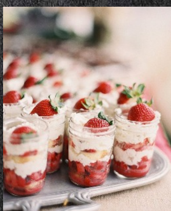
Трайфл со свежей клубникой